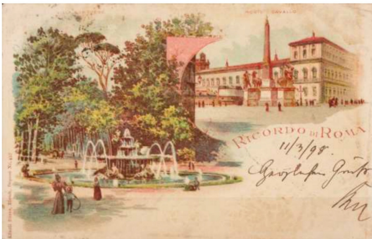
Cartolina ricordo con la Fontana dei Cavalli Marini, 1898

Lo scorso anno, nella giornata conclusiva dello CSIO di Piazza di Siena - Master d'Inzeo, è andata in scena una piccola, semplice "cerimonia dell'acqua" : i vertici di Sport e Salute e FISE, assieme ai rappresentanti della Sovrintendenza Capitolina ai Beni Culturali, hanno ridato vita alla Fontana , aprendo la via dell'acqua e girando le leve che attivano il nuovo impianto idrico della Fontana. Il restauro ha consentito il recupero dell'aspetto originario della fontana e dei suoi getti d'acqua, nonché della sua valenza prospettica legata alla percezione estetica dell'invaso di Piazza di Siena e del soprastante viale dei Cipressi. Inoltre, nel pieno rispetto delle moderne esigenze in termini di risparmio idrico e tutela ambientale, il restauro ha eliminato definitivamente i gravi problemi di perdita e dilavamento del sottostante emiciclo di Piazza di Siena.